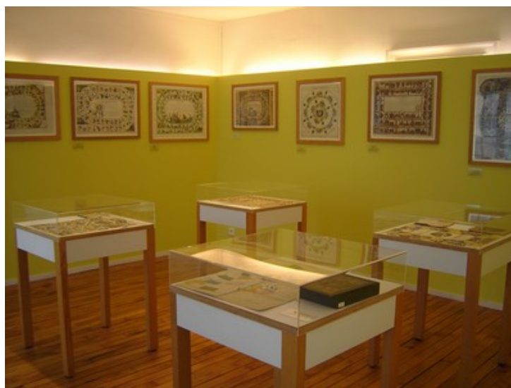
Salle du musée du jeu de l'oie

La présentation du moment - à travers 70 exemples représentatifs consiste en un survol de l'histoire et de la typologie du jeu de l'oie, à la fois objet ludique et pédagogique, véritable témoin des préoccupations d'une époque et dans l'Europe entière (Allemagne, Italie, Grande-Bretagne, Pays-Bas, Belgique...).